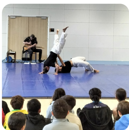
Au gymnase du Collège Thomas Pesquet (Castres-81)