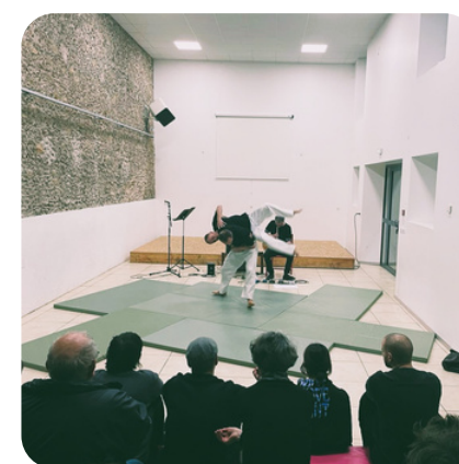
A la Médiathèque de Verniolle-09