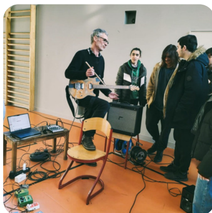
Au gymnase du Collège Balzac (Albi-81)