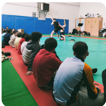
Au gymnase du Collège Louis Pasteur (Graulhet-81)