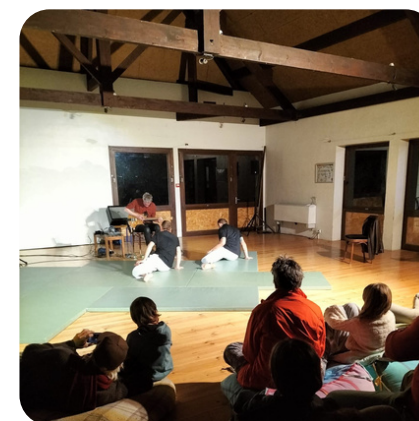
A La Soulane (Jézeaux-65), Tiers-Lieu éco-créatif et culturel de montagne