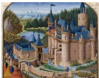
Château fort des seigneurs Moyen âge