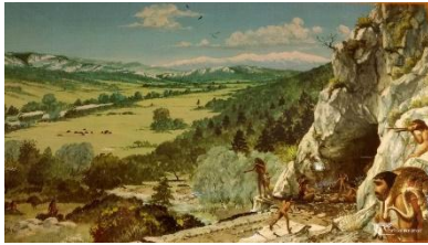
Grotte de Tautavel Préhistoire

Vous pouvez rapidement présenter l'habitat de la préhistoire à nos jours.