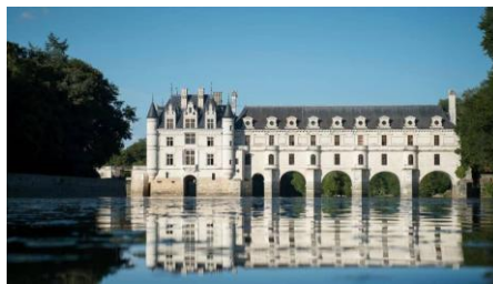
Château La Renaissance