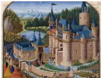
Château fort des seigneurs Moyen âge