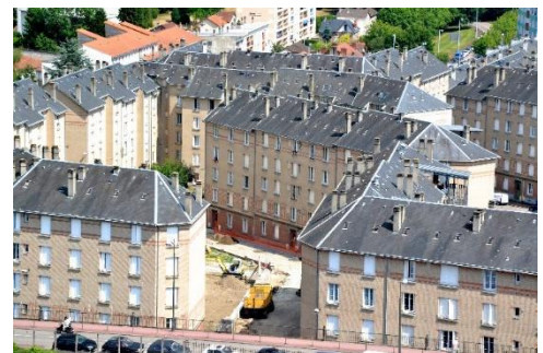
Habitations 20 e siècle

Si ces lieux d'habitations existent ou ont existé, les « maisons » imaginaires peuvent se construire également.