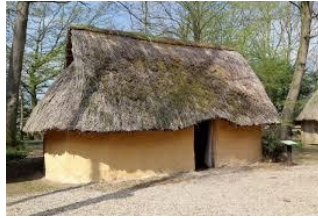
Reconstitution maison Gauloise Antiquité