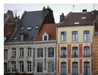
Habitation 18 e siècle