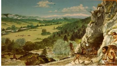
Grotte de Tautavel Préhistoire

Vous pouvez rapidement présenter l'habitat de la préhistoire à nos jours.