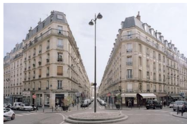
Immeubles Haussmann 19 e siècle