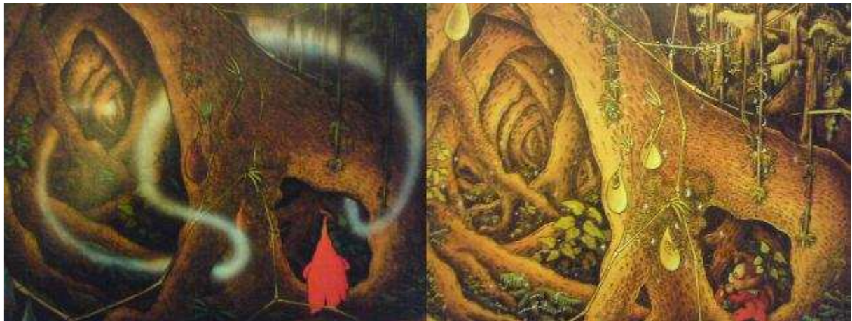
Figure 2: la première image représente le début de son voyage, la seconde son retour.