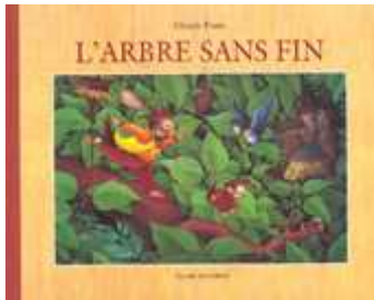
Figure 1: la couverture de l'ouvrage.